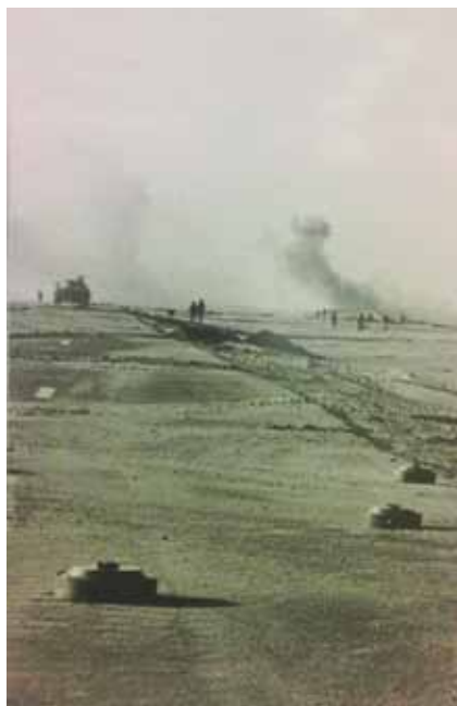
עוד ניסיון שלנו לחבור למעוז בודפשט, 8 באוקטובר 73

* דברים שנאמרו במפגש עם תלמידי י"ב לציון 40 שנים למלחמת יום הכיפורים