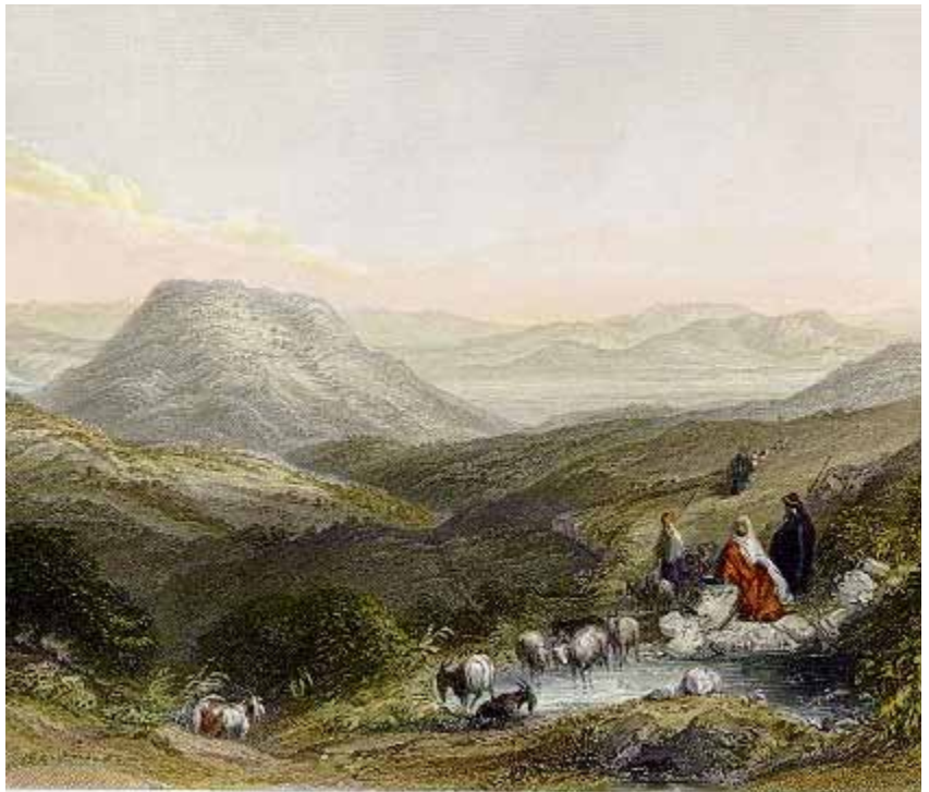
ציור של הר תבור - ברטלט 1840 ◀ "ותאמר דבורה אל־ברק קום, כי זה היום אשר נתן ה' את־סיסרא בידך, הלא ה', יצא לפניך; וירד ברק מהר תבור, ועשרת אלפים איש אחריו. ויהם ה' את־סיסרא ואת־כל־הרכב ואת־כל־המחנה לפי־חרב לפני ברק" (שופטים ז, יז-טו)

דבורה היא המנהיגה הבלתי מעוררת של המרד, ולכן ברשותה מידע מלא על מה שהתרחש לפני המרד ובמהלכו, ואילו ברק בן־אבינועם, חשוב ככל שיהיה, הוא רק אחד ממפקדי הכוחות, ובידו מידע המתייחס רק למה שהתרחש בגזרתו. לדוגמה, לפי תיאורו של הכהן שמלווה את ברק חוסל סיסרא, מפקד הכנענים, לאחר שפותה. 19 לאחר מכן נמסרה גופתו לצבא המנצחים (אולי כדי לטהר את בית הקיני מאשמה עתידית של שיתוף פעולה עם הכנענים). לעומת זאת, דבורה מתארת סצנה של אונס אכזרי שבמהלכו מצליחה הנאנסת להתגבר על תוקפה - ללא שום קשר למלחמה שמתחוללת מחוץ לאוהל. הדעת נותנת שהגרסה השנייה נשענת על מידע רב יותר, ואילו ברק ראה את כל הפרשה מבעד למנסרה הדקה של הלחימה בכנענים. לכן גרסת דבורה היא הסבירה יותר. אשר לגרסאות השונות בנוגע לגודלו של הכוח הלוחם של הישראלים: כאמור, לפי גרסת ברק