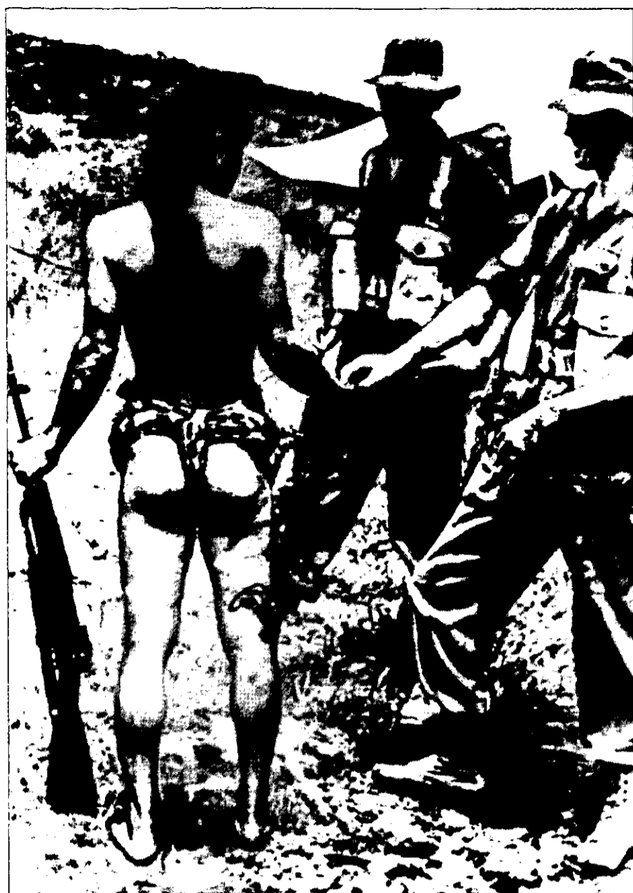
לוחם בן שבט הדייק (Dyek) עם לוחמים בריטים. בני שבט זה גויסו לעזרת הבריטים בזכות הכרתם את הג'ונגלים במלאיה

הבריטים להבין את מהותה ואת אופיה של מלחמת הגרילה המהפכנית. המפקד העליון של כוחות בריטניה במזרח הרחוק, לוטננט-גנרל סר ניל ריצ'י, טען כי אסטרטגיה הגנתית פעלה לטובת הגרילה, ואילו אסטרטגיה התקפית תביא את לוחמי הגרילה לנוע ממקום למקום, בלי שיוכלו להתארגן בקרב האוכלוסייה המקומית. 7 בעקבות ההבנה כי