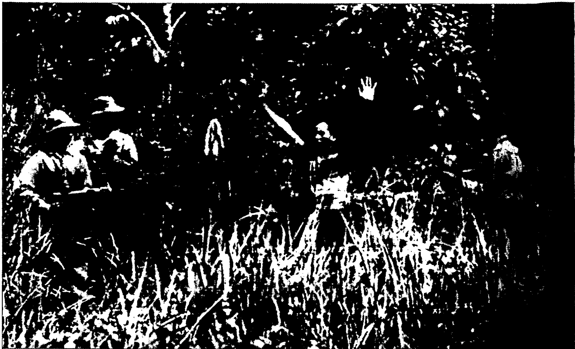
לוחם גרילה קומוניסטי נתפס במטע גומי במלאיה

לפעילות ולנוכחות של הקומוניסטים בכפר או באזור נתון. מדד מרכזי לכך היה תקופה ארוכה שבה לא היו תקריות אש בין כוחות הממשלה לבין הקומוניסטים. באותו אזור הוסרו כל ההגבלות ומחסומי הדרכים, ונקודות הבדיקה בוטלו במטרה להחזיר את הכפריים לאורח החיים הנהוג בעיתות שלום. יתר על כן, משפחות ויחידים תוגמלו במענקי כסף או קרקע בעבור שיתוף פעולה עם כוחות הממשלה. 14 השיטה הזאת הייתה המדד להצלחת הבריטים במלחמת הגרילה שלהם, ועד 1960 הוכרזה כל מלאיה (למעט אזור מצומצם בהיקפו בגבול עם תאילנד) "לבנה".