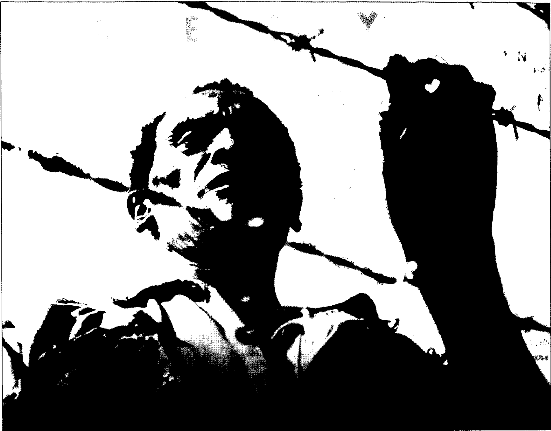
לוחם מאו מאו שנפל בשבי

נקודת המפתח להצלחה הייתה שליטה ופיקוח על האוכלוסייה המקומית וזכייה בתמיכתה. האוכלוסייה המקומית הייתה (והינה) הבסיס של לוחמי הגרילה בכל מקום ובכל זמן. האוכלוסייה המקומית סיפקה מזון, מחסה ומודיעין, ומקרבה גויסו לוחמים חדשים. הצרפתים, שהתמודדו גם הם עם שתי תנועות גרילה באותה תקופה