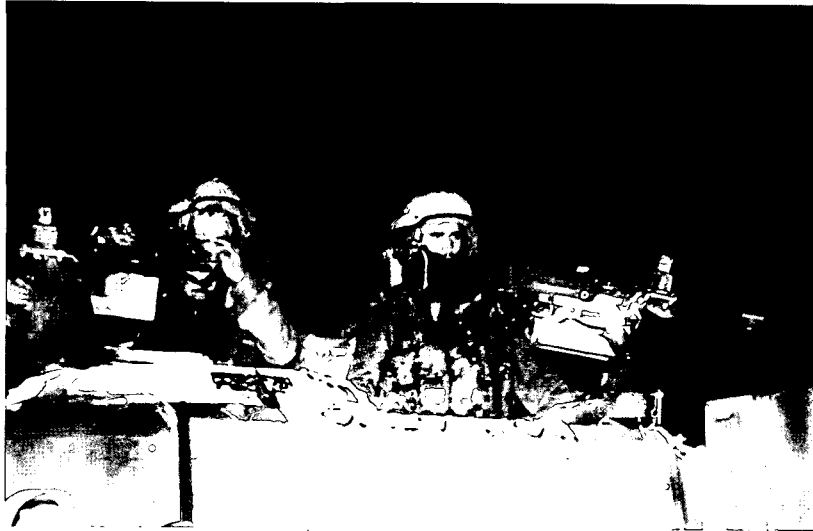
כוחות צה"ל בפעילות שגרתית בלבנון

עשיר במעיינות ובנחלים סחבו איתם החיילים כמויות אדירות של מים. ואם לא די בכך, הרי בעקבות לקחים אחרים שהופקו מפעולות קודמות לקחו עימם החיילים לכל פעולה גם מכשירי קשר בעלי הספק מוגבר ומוצפנים וכן מכשירי גיבוי וסוללות גיבוי רבות. נוסף על כך הם נשאו איתם ציוד הנדסי רב