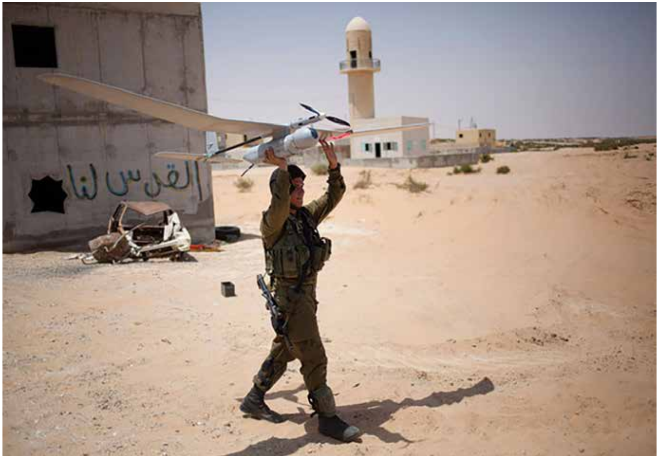
שיגור מזל"ט טקטי מסוג רוכב שמיים לאיסוף מודיעין | ההתקדמות הטכנולוגית המסחררת של העשורים האחרונים יצרה יכולות איסוף המאפשרות למפקד בשדה הקרב המודרני לשפר את שליטתו בסביבתו במהלך ההכנות לקרב ותוך כדי ניהול הקרב ולהשתמש במשאבים העומדים לרשותו באופן מיטבי אל מול תמונת מצב ומשימה נתונות, לקבל החלטות טובות יותר ולהגיע לתוצאה הרצויה

משמעותיים למפקד בשדה הקרב הטקטי. על אף השינויים בטכנולוגיה, המפקד נותר אדם, וכפי שהוסבר קודם לכן, המגבלות האנושיות בתהליך הקליטה והעיבוד של המידע שרירות וקיימות גם בעת הזאת. כדי להתמודד עם אתגרי הטכנולוגיה וכדי לייעל ולטייב את מערכות השו"ב התומכות במפקד הטקטי מומלץ לאמץ כמה עקרונות שיאפשרו לסנן, לעבד, להתיק ולתעדף מידע לפי צורכי המפקד בשדה הקרב המודרני: בשלב הראשון מוצע לבנות את הכלים