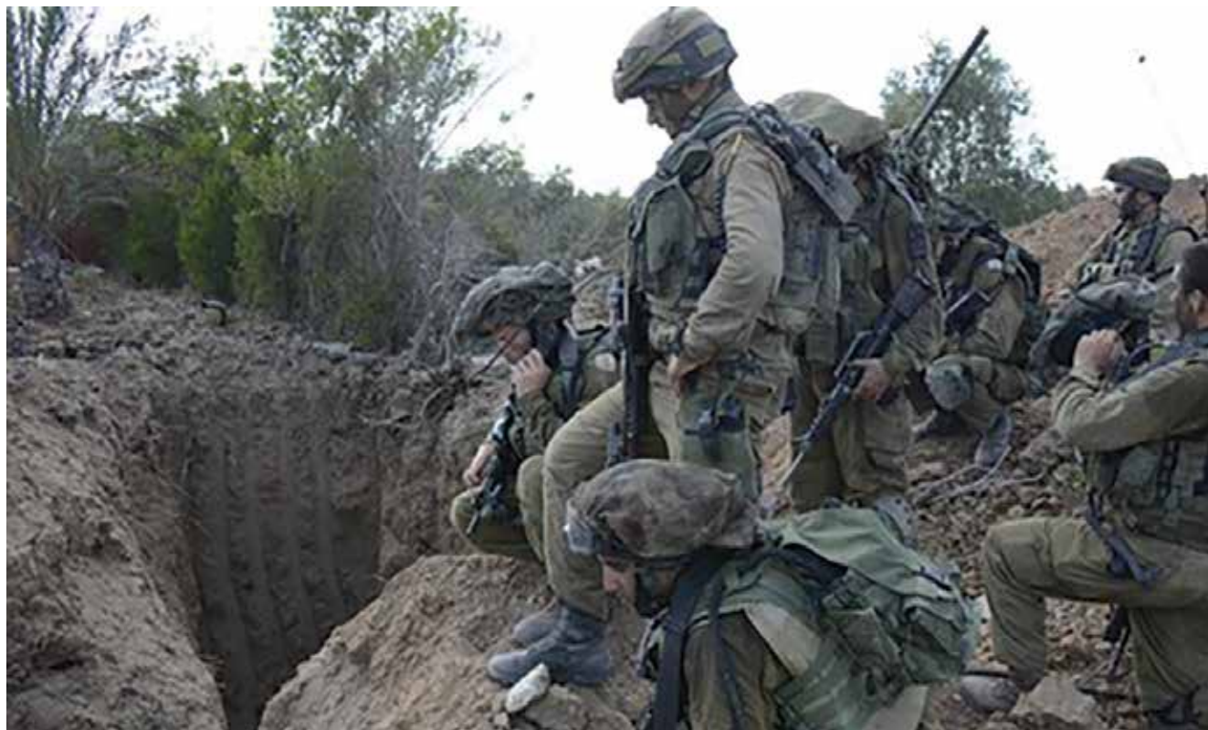
חיפית מנהרה ב"צוק איתן" | מלחמת השוחות של תחילת המאה ה־20 ומלחמות התמרון בסופה פינו את מקומן לשדה הקרב המודרני של המאה ה־21 שבו צבאות סדורים נלחמים בעיקר במרחבים מורכבים ועירוניים אל מול אויב לא סדור, מוסתר, דינמי וקשה לחיזוי המתבסס על לוחמת גרילה, על תוואי שטח סבוכים ועל התווך התת־קרקעי

למוח האנושי יש יכולת לאחסן כמות עצומה של מידע. אולם בדומה לרוב המשאבים, גם במשאב הזה קיימים "צווארי בקבוק" וחסמים בדרך לקבלת החלטות. אלה נובעים מהצורך לסנן מידע מרעשי רקע, לעבד מידע, להשוותו עם נתונים ועם פריטי מידע נוספים, לבחון דרכי פעולה אפשריות ולבסוף לקבל החלטה. השלב של סינון המידע הוא מאתגר במיוחד. צרכן המידע - במקרה הנידון המפקד הקרבי - נדרש לבחור את פריטי המידע הנדרשים לו כדי להעבירם לעיבוד. לשם כך עליו לזהות את כל פריטי המידע הפוטנציאליים לשם קבלת ההחלטה, להפריד בין עיקר לטפל, לסנן את פריטי המידע המשמעותיים המשלימים