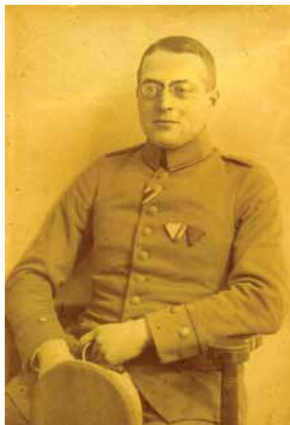
סגן-רפואה (Oberarzt) ד"ר פליקס טיילהבר, רופא צבאי גרמני במלחמת העולם הראשונה, 1915

"ריב הסטטיסטיקות" בין היהודים לגורמים שניהלו את מסע התעמולה הנאטישמי נגדם נמשך כל ימיה של רפובליקת ויימאר. החשיבות שייחס הצד היהודי לאומדנים, לטענות המספריות ולנימוקים הדמוגרפיים והסטטיסטיים כדי לתת מענה להסתה תרמה לאופיה האפולוגטי של התגובה היהודית. עוצמת הפגיעה שחשו ותיקי המלחמה היהודים בעקבות הטענות של בני ארצם עשויה אולי להסביר מדוע התמידו באמונתם כי בכוחן של עובדות לתקן את העוול שנגרם להם. הערות למאמר באתר מערכות.