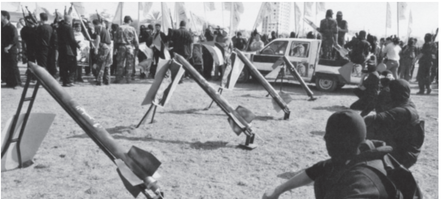
אנשי חמאס מציגים לראווה טילי קסאם | קלאוזביץ טען שמלחמת גרילה יכולה להצליח רק אם היא משולבת בלחימה של צבא ודיר. הניסיון ההיסטורי מוכיח שהוא טעה

ורעננים - בניגוד לצבא הסדיר שהובס - ולכן הם עשויים להביא למפנה לטובת המדינה שהובסה. יש לשער שקלאוזביץ מסתמך בקביעה הזאת על הדוגמה של פעולת הגרילה בספרד נגד צבא צרפת. הספרדים השתמשו בטקטיקות לא סדירות רק אחרי שהכוחות הסדירים שלהם התמוטטו. על פי הרכבי, הם בחרו באסטרטגיה של מלחמת עם רק כאשר זו נותרה האפשרות היחידה שלהם. 8 אולם קלאוזביץ אינו מתמקד רק בטיעונים של תועלת צבאית ומדינית. הוא מעלה טיעונים מוסריים נוקבים בנוגע לחובתה של מדינה לנצל את אמצעיה עד תום ולא להשלים עם כניעה לאויב בלי שמיצתה את כוחות העם. 9 לדידו, ממשלה שאינה עושה כן היא חלשה, בלתי מוסרית ומוכיחה שאינה ראויה לניצחון. אף שקלאוזביץ אינו מציין זאת במפורש, נראה שהדברים האלה מבטאים רגשות חזקים הקשורים ל"כניעתה ללא קרב" של פרוסיה לנפוליאון ב-1812. כפי שצוין קודם לכן, קלאוזביץ סלד מהחלטתו של מלך פרוסיה להעמיד גיס של צבא פרוסיה לרשות נפוליאון במלחמתו נגד רוסיה. הוא ראה בהחלטה הזאת כניעה ללחץ, רפיסות מדינית ופגיעה בלאומיות הפרוסית. כאמור, בעקבותיה הוא התפטר מהשירות בצבא פרוסיה ועבר לצד הרוסים.