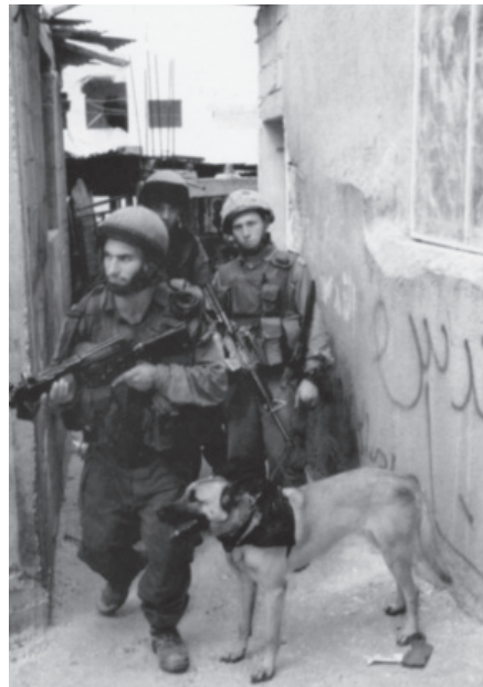
לוחמי צה"ל במרדף אחר מחבלים | קלאוזביץ טען שאוכלוסייה ענייה נוטה להיות לוחמנית יותר

במאמר הזה אני מנתח את תפיסתו של קלאוזביץ בנושא הלוחמה הזעירה. בחלקו הראשון אני סוקר את הרקע הצבאי של קלאוזביץ ואת האירועים שהובילו אותו לעסוק בלוחמה הזעירה ועיצבו את דעותיו בנושא הזה. בחלקו השני אני בוחן בפירוט את הגותו של קלאוזביץ בנושא הלוחמה הזעירה