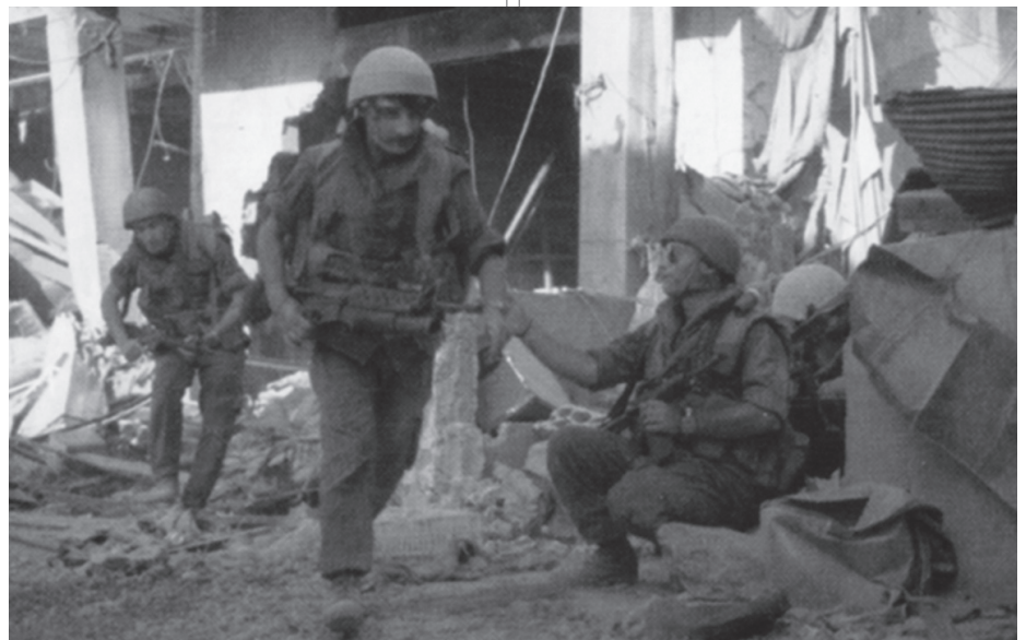
יחילי צה"ל בפרבריה הדרומיים של ביירות - 1982 | במלחמת של"ג לחם צה"ל במקביל נגד כוחות סדירים של צבא סוריה ונגד יחידות מחבלים. חלק ניכר מהעיכוב בהתקדמות הכוחות היה תוצאה של לחימת המחבלים ולא רק של הצבא הסורי הסדיר

ברוב המקרים שבהם הצליחה הגרילה, היא נשענה על בסיס של כוח סדיר ועל מדינה שסיפקו לה את צרכיה הקיומיים והמבצעיים, ואילו ברוב המקרים שבהם לא הייתה לגרילה תמיכה כזאת - היא הובסה בסופו של דבר. טענתי היא שאופן השילוב בין הכוחות הסדירים לכוחות הבלתי סדירים שמציע קלאזוביץ הוא ארכאי ולא ישים בימינו. 18 אבל קלאזוביץ כתב על בסיס הניסיון וההבנה שהיו קיימים בתקופתו. במלחמתה של רוסיה נגד נפוליאון ב־1812, שבה, כאמור, השתתף באופן פעיל, שולבו בלחימה הסדירה פשיטות ומבצעי קומנדו של יחידות צבא ושל איכרים. 19 יש לשער אפוא שניסיונו האישי של קלאזוביץ בשירות הצבא הרוסי באותה עת חיזק אצלו את ההבנה שלוחמת גרילה בשילוב