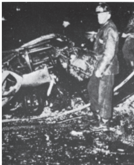
פיגוע של האף-אל-אן באלג'יר, 1962 | קלאוזביץ ראה בגרילה אמצעי הגנה על המדינה כולה

סוגיה מרכזית שיש לבחון היא תפיסתו של קלאוזביץ בנוגע לשילוב בין הצבא הסדיר ללוחמת גרילה. כאמור, קלאוזביץ דגל בשילוב כזה בהתאם לתוכנית אסטרטגית מתואמת, שבה הצבא הסדיר מנהל לחימה סדורה והוא המרכיב הדומיננטי. הוא הצהיר בפירוש שאין ביכולתה של לוחמת גרילה לבדה להשיג את ההישג האסטרטגי הנדרש. אולם במאה ה-20 היינו עדים להיפוך המגמה: היו מקומות שבהם הצבא הסדיר הוא ששייך לגרילה, דהיינו הגרילה היא שהייתה הדומיננטית. 25 למשל, על-פי תפיסתו של מאו דזה-דונג נועד הצבא הסדיר לתת את המכה המכרעת - אבל רק