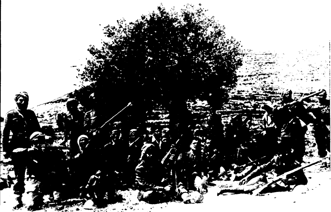
כנופיה ערבית במלחמת העצמאות

לאחר זמן מה ראיתי על הרכס מולי עשרות ערבים מזוינים שצפו לעברנו כדי לגלות אם במקום נמצא כוח, לאחר שראו את הפלוגה עולה למעלה. החלטתי לנקוט שיטת חיפוי מיוחדת, שנכנסה לי לראש ונראתה לי מתאימה למנוע מהערבים לזהות את מיקום הכוח שלנו ואת גודלו. לאחר זמן מה הם החליטו לשלוח מספר חיילים קדימה, אך לא הגבתי על כך. אבל כאשר החליטו, כנראה, כי במקום אין חיילים יהודים, וכולם החלו להתקדם, נתתי לאנשיי פקודה לירות עליהם בבת אחת כדור אחד מכל כלי-הנשק, כולל המקלעים. ההלם אצל הערבים היה חזק, שכן הם לא יכלו לדעת בעקבות ירי פתאומי של כדור אחד מהיכן יורים עליהם, וכמה חיילים נמצאים על הרכס. הערבים נצמדו לקרקע וחיכו להמשך הירי, אך זה לא הגיע, כי חיילי נצרו את נשקם. הם ניסו למשוך אש מצידנו על-ידי התרוממות