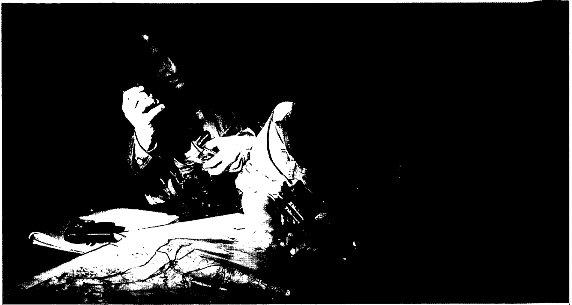
קציני המטה של המח"ט הם שהופכים את החטיבה לגוף שיכול לבצע את כל המשימות המוטלות עליו*

הרבות בעת ובעונה אחת על ידי הבנתם את המשימות ואת גבולות הגזרה (בכל המובנים) ובעיקר הודות לאחריותם הבלתי מתפשרת בגזרתם.