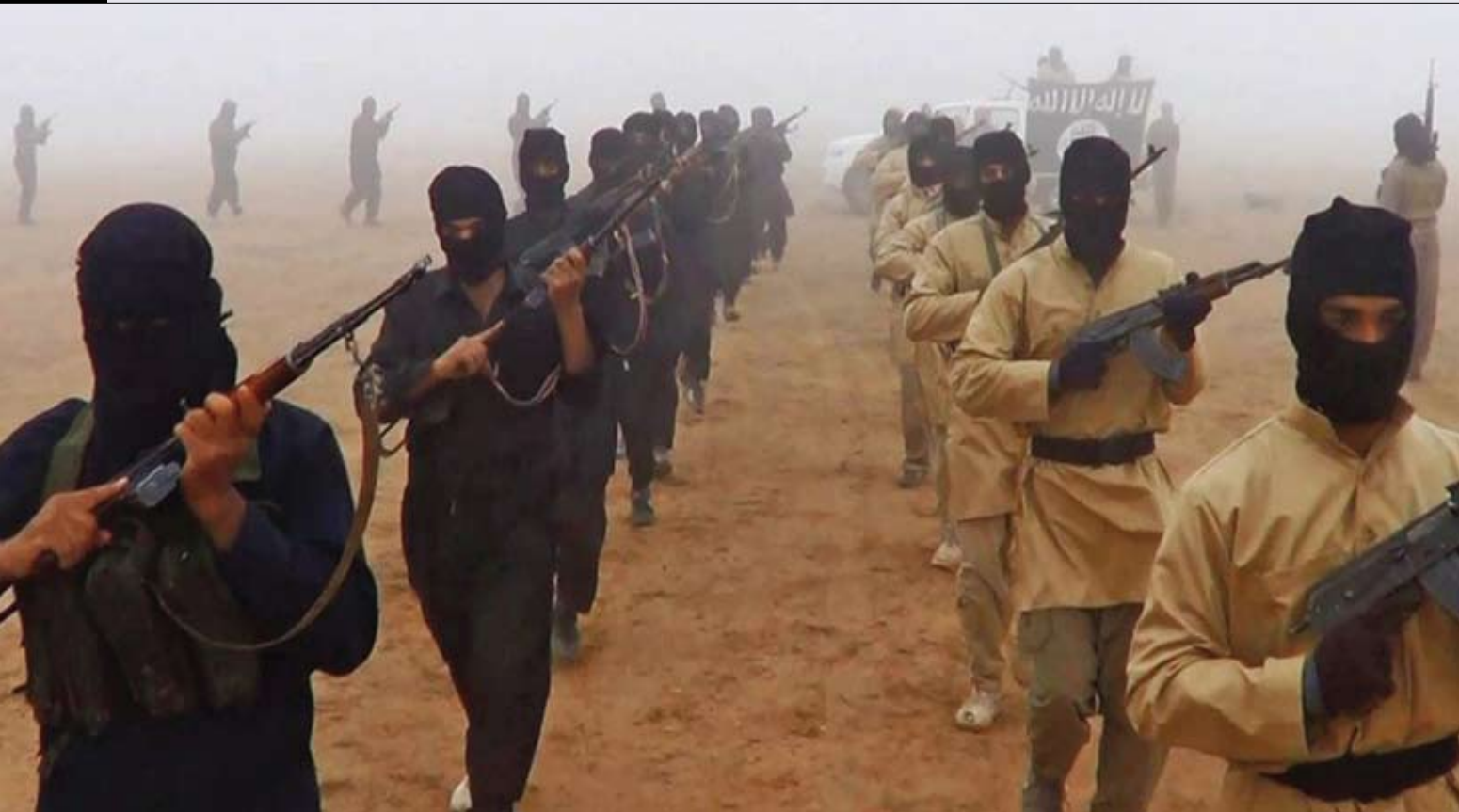
כוחות רגליים של צבא המדינה האסלאמית (דאעש). עוצמתו העיקרית של צבא המדינה האסלאמית היא חיל רגלים קל ממונע המסתייע במגוון כלי נשק בינוניים

למרחבים מסוימים, ובתוכם על היצמדות פחות או יותר לצירי התחבורה הראשיים. עד כה סדר העדיפויות היה: כיבוש האוכלוסייה הערבית-סונית, ולאחר מכן הכורדית-סונית תוך כדי כיבוש נכסים כלכליים מניבים והבטחת חיבור קרקעי בין המדינה האסלאמית לבין תורכיה.