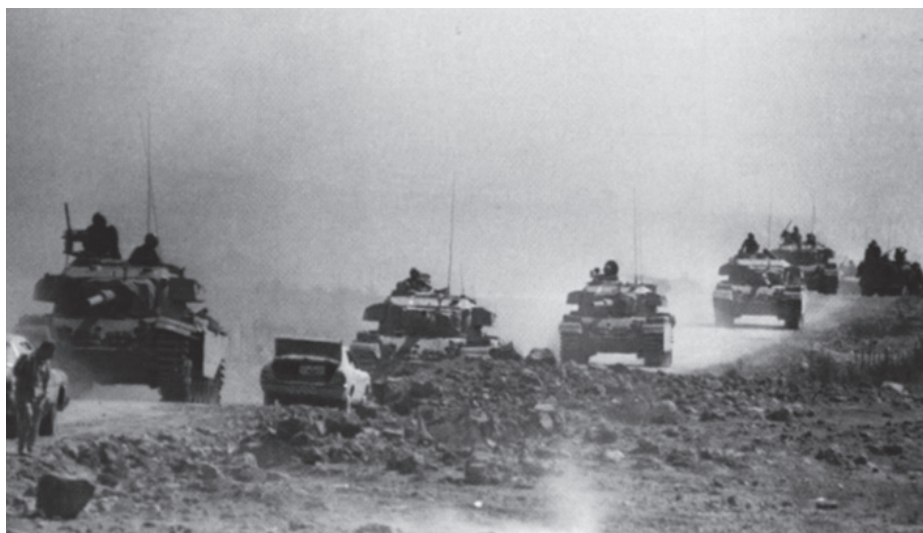
מתקפת הנגד של צה"ל ברמת-הגולן | ב-12 באוקטובר שב איסמעיל עלי והציע לפתוח במתקפה מזרחה, לעבר המעברים בסיני, אלא ש"עתה היה בפינוי ניהול חדש: להפחית את לחץ האויב על סוריה"

לדעת גמאסי, ההחלטה לתקוף לעבר מעברי ההרים בהתאם לתוכנית המלחמה מומשה בסופו