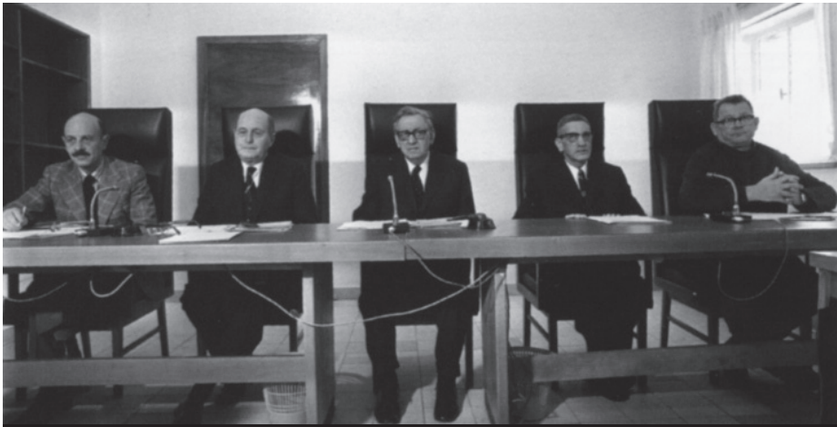
ועדת אגרנט | אין שום בעל מקצוע, ולו המוכשר ביותר, שלא שגה וטעה לאורך שנות התפתחותו המקצועית, אך נדמה שמהעוסקים במקצוע הצבאי מצפים בדיוק לכך: היסטוריה עם אפס טעויות

מדמה את מצב האמת במידה המרבית חוטא חטא חמור, שכן אחריותו הראשונה של מפקד כלפי חייליו היא הכנתם המיטבית לאתגר הקיצוני ביותר שבפניו הם עלולים לעמוד - הקרב. למפקדים תחומי אחריות נוספים כלפי חייליהם, למשל אחריות לתנאי השירות שלהם, אולם אין לטעות בסדר החשיבות, וקביעת רמת החשיבות ראוי לה כי תונחה על-פי שיקולים מקצועיים יותר מאשר על-ידי לחץ ציבורי.